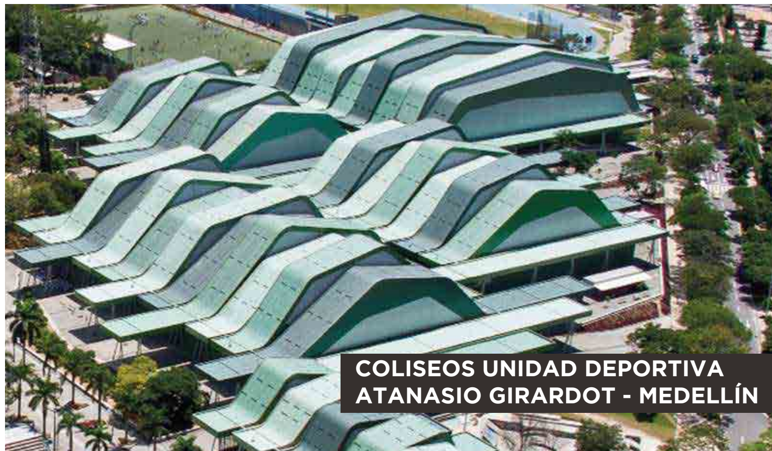
COLISEOS UNIDAD DEPORTIVA ATANASIO GIRARDOT - MEDELLÍN