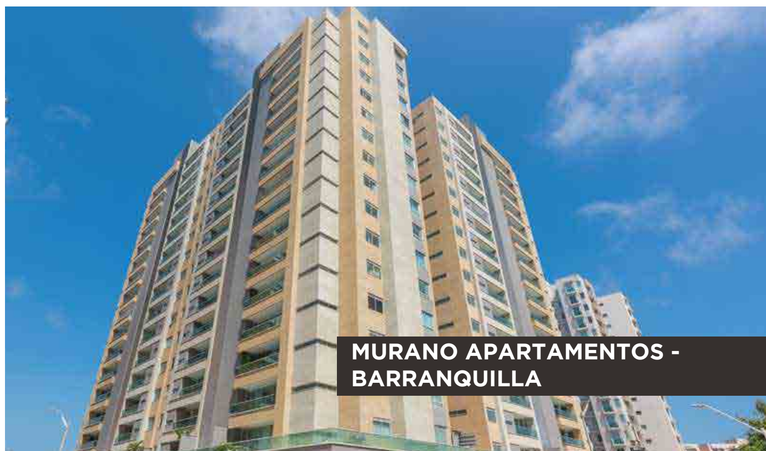
MURANO APARTAMENTOS - BARRANQUILLA