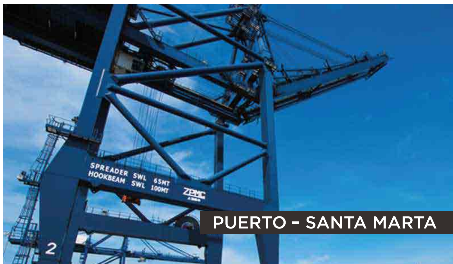
PUERTO - SANTA MARTA